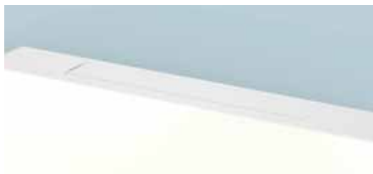
ALETTA CON GLASS SPENTO